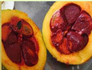
木鳖子 冷冻、无菌果肉