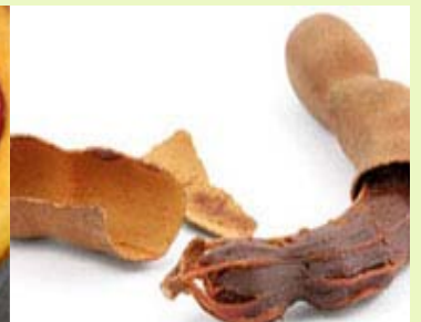
罗望子 冷冻、无菌原浆