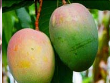
芒果 无菌、冷冻原汁