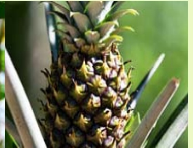
菠萝 无菌、冷冻原浆、原汁