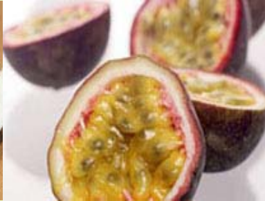
西番莲 无菌、冷冻原汁