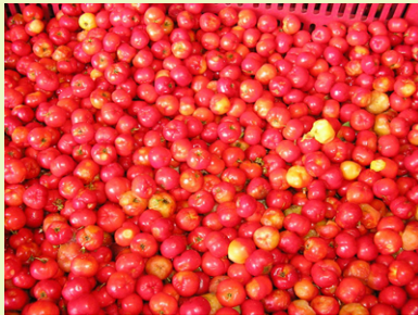
西印度樱桃 冷冻、无菌果肉