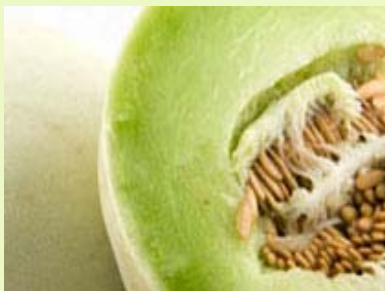
蜜瓜 无菌、冷冻果肉