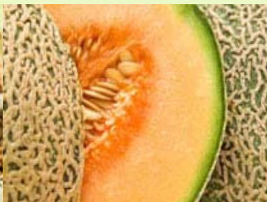
哈密瓜 无菌、冷冻果肉