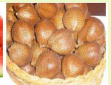
蛇果 无菌、冷冻果肉