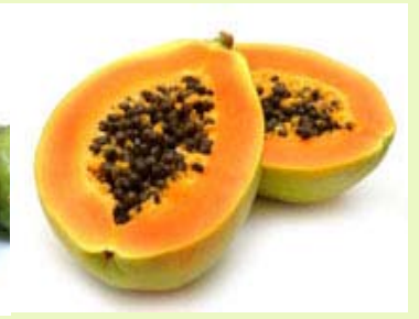
木瓜 无菌、冷冻果肉