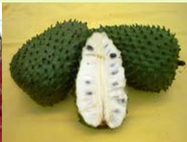
刺果番荔枝 无菌、冷冻果肉