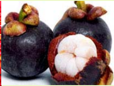
山竹 无菌、冷冻原汁