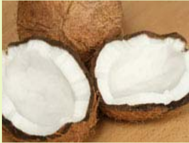
椰子 椰蓉、冷冻椰块