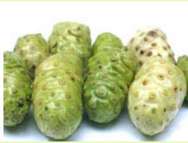
诺丽果 无菌、冷冻果肉