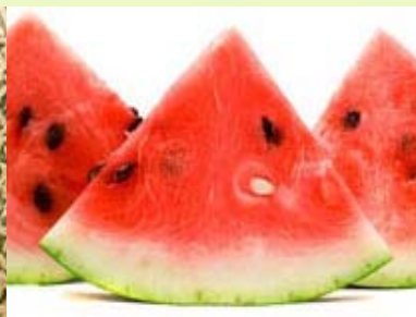
西瓜 无菌、冷冻果肉