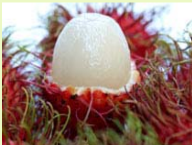
红毛丹果 无菌、冷冻原汁